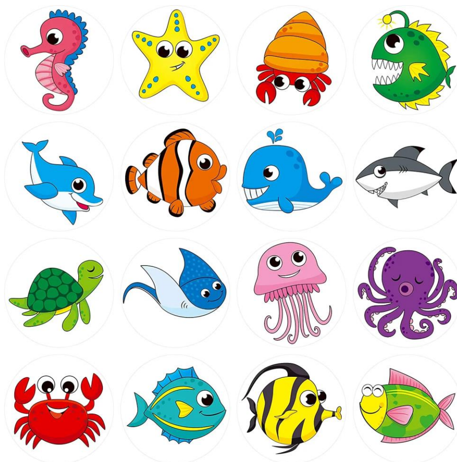
Рис. 3. Примеры наклеек рыбок с эмоциями.