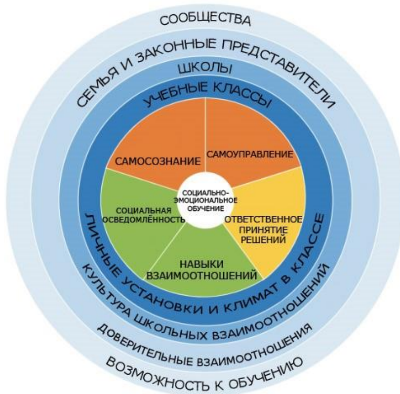
Схема 1. Колесо компетенций CASEL

Организация CASEL выделяет пять основных компетенций, которые учащийся должен развить в процессе социально-эмоционального обучения (Схема 1):