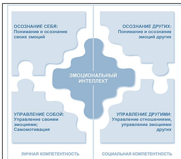
Схема 2. Модель эмоционального интеллекта Д.Гоулмана

Два сектора «Осознание себя» и «Управление собой» составляют личную компетентность, а другие два сектора «Осознание других» и «Управление другими» составляют социальную компетентность (Схема 2).